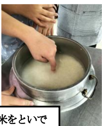
お米をといで 水加減を調整

当日は、それぞれの役割（野菜を準備するチーム、火起こし・炊飯に取り組むチーム等）を自覚・協力し、昼食作りに励みました。さすが6年生は、去年の経験をいかしてスムーズに仕事を進めていきます。その活躍ぶりから「火起こし名人、包丁名人」の称号(?)を手にした児童もいました。片付けは、食器洗い・お釜みがき・流し口のゴミ処理等々に、全員で汗を流していました。鹿沼のめあて「自分で、協力、責任もって」を体現した活動ぶりに、心洗われるおもしろい校長でした…。