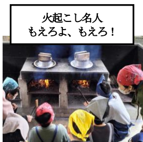
火起こし名人 もえろよ、もえろ！