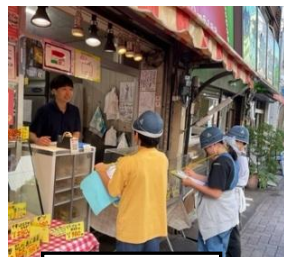
お店の方に インタビュー