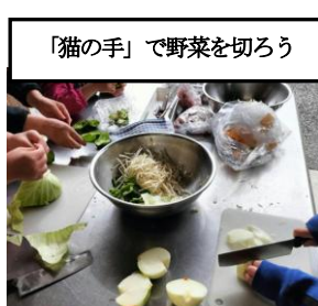
「猫の手」で野菜を切ろう