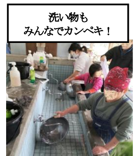
洗い物も みんなでカンペキ！