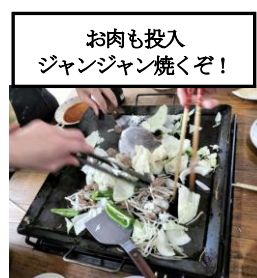
お肉も投入 ジャンジャン焼くぞ！